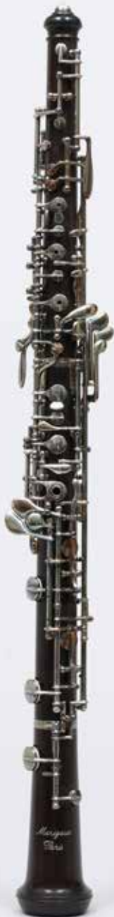
Hautbois, MARIGAUX, prototype série « 2001 » La Couture-Boussey, 1999