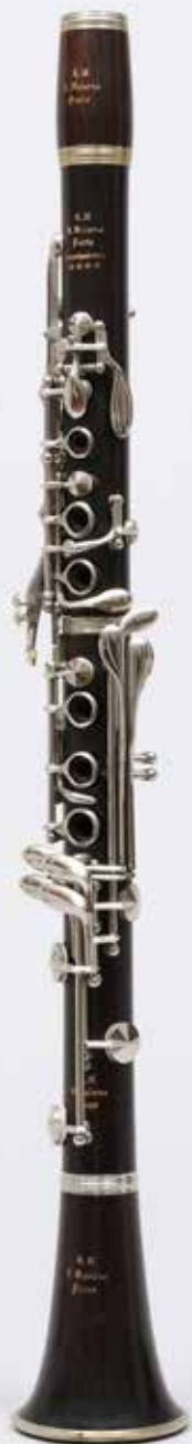
Clarinette, R. MALERNE, série Professional La Couture-Boussey, années 1970