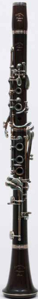
Clarinette, MARIGAUX, modèle RS Symphonie La Couture-Boussey, après 1980