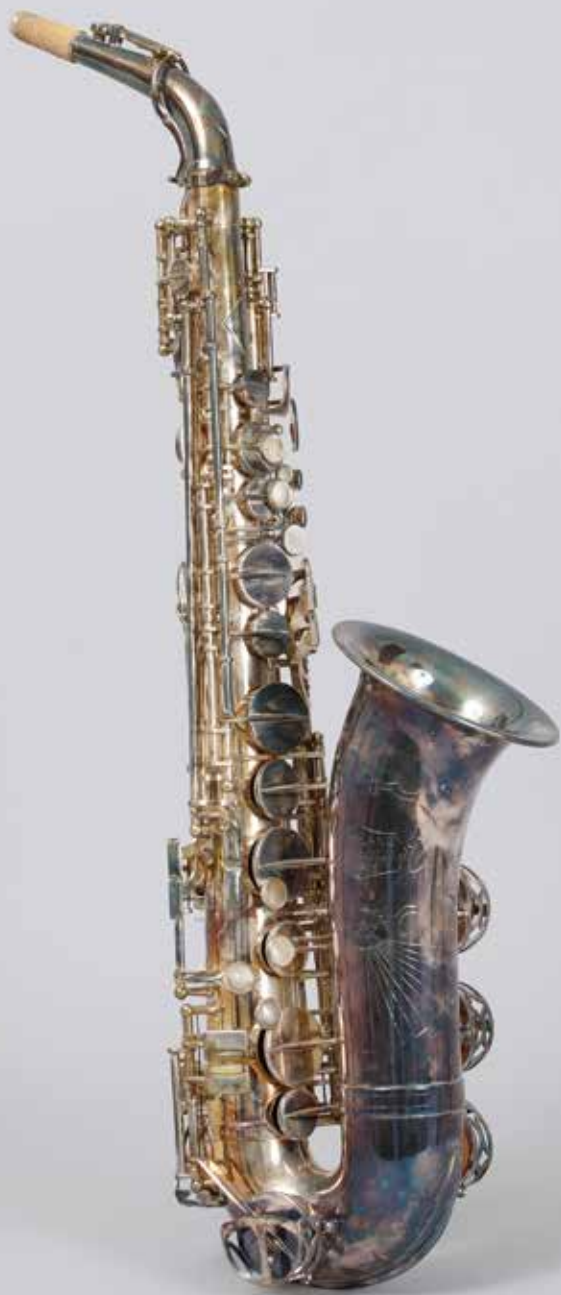
Saxophone alto SRB, G. LEBLANC Paris, 1931-1935