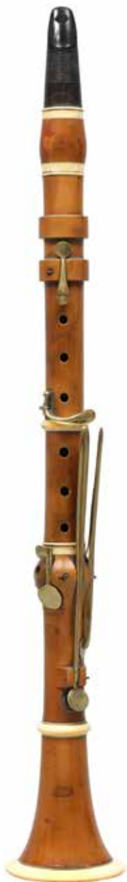
Clarinete en Sib, NOBLET Jeune La Couture-Boussey, ca. 1830