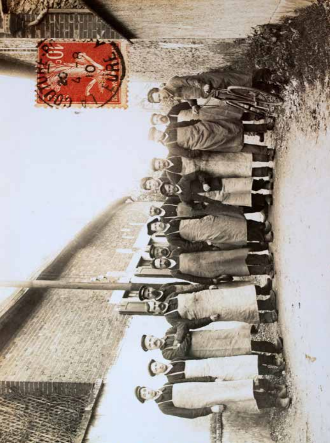
Ouvriers devant l'usine Laubé posant rue du Puits, avant 1910, La Couture-Boussey.