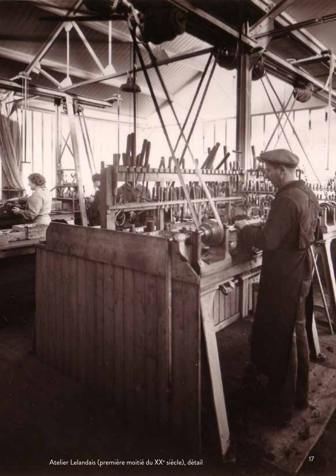
Atelier Lelandais (première moitié du XX e siècle), détail