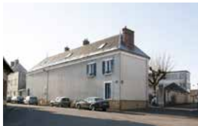
Vue générale de la maison et de l'atelier depuis la rue Grande, aujourd'hui. Le "L" de Laubé est toujours visible sur la souche de cheminée

Une carte postale plus célèbre est prise depuis la cour de l'usine (l'atelier est en arrière-plan, le logement sur la droite).