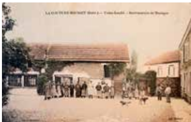
Usine Laubé - instruments de musique, début XX e siècle. Carte postale

Une catégorie d'images est particulièrement intéressante : celle des photographies d'ouvriers. Les ouvriers posent avec, en main, l'instrument qu'ils fabriquent ou l'outil