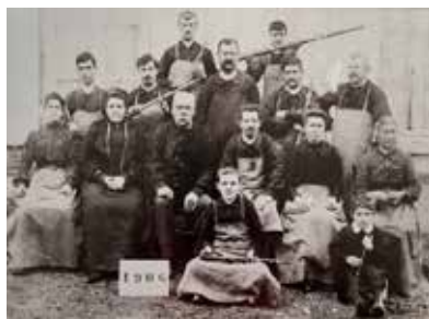
Atelier Noblet-Leblanc, 1906

Dans le cadre de l'opération d'inventaire du patrimoine mené sur le territoire de La Couture-Boussey, Ézy-sur-Eure, Ivry-la-Bataille et Garennes-sur-Eure de 2014 à 2017, les fonds documentaires du Musée, fruit de multiples dons, ont constitué une source indispensable pour illustrer l'activité des entreprises locales. Constitués d'en-têtes de factures, de cartes postales, de photographies, de courriers, ces fonds documentaires, non exposés et pour une grande part restant à identifier, sont une mine d'informations pour identifier et retracer l'histoire des usines du territoire.