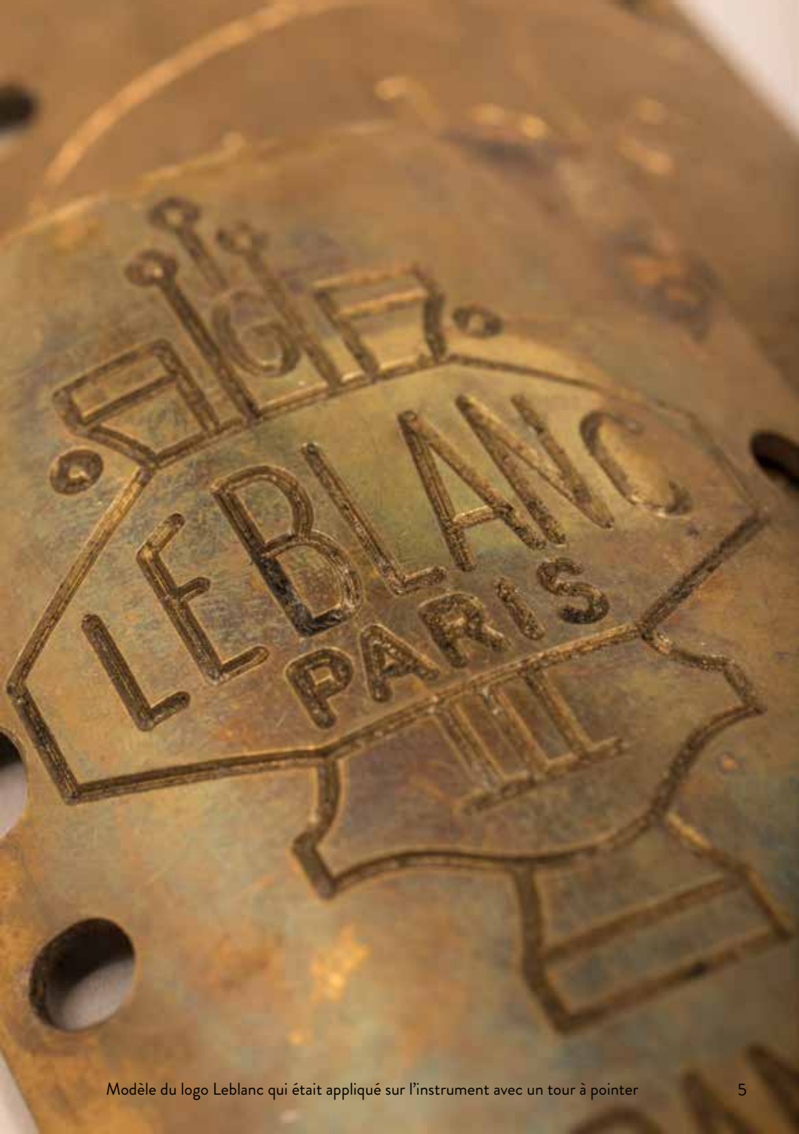
Modèle du logo Leblanc qui était appliqué sur l'instrument avec un tour à pointer